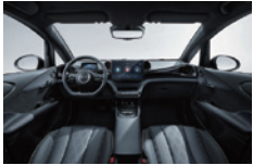
Svart och grå