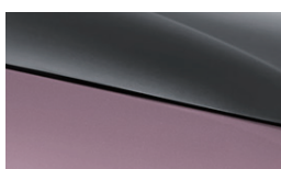
Coral Pink + Urban Grey