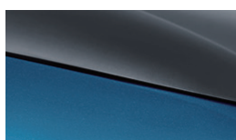
Surfing Blue + Urban Grey