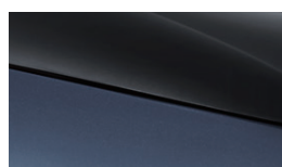
Atlantis Grey + Jet Black