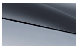
Skiing White + Urban Grey