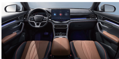
Svart och brun