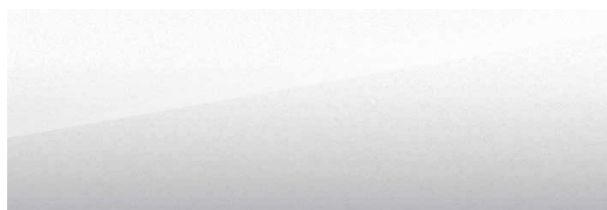
Snow White (vit)