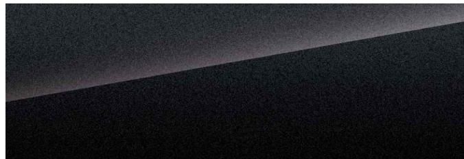
Silver Sand Black (svart)