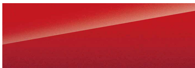
Emperor Red (röd)