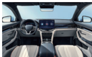
Blå och grå